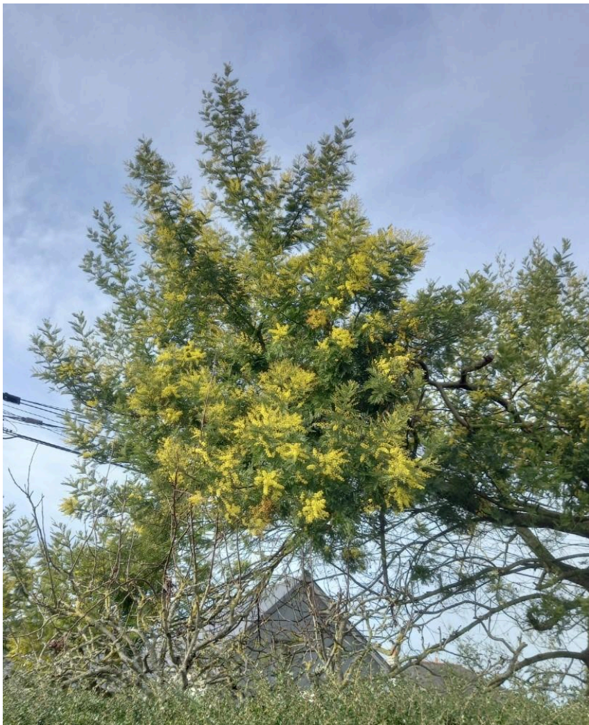
Un des rares mimosas en fleurs! Et encore, pas très beau!