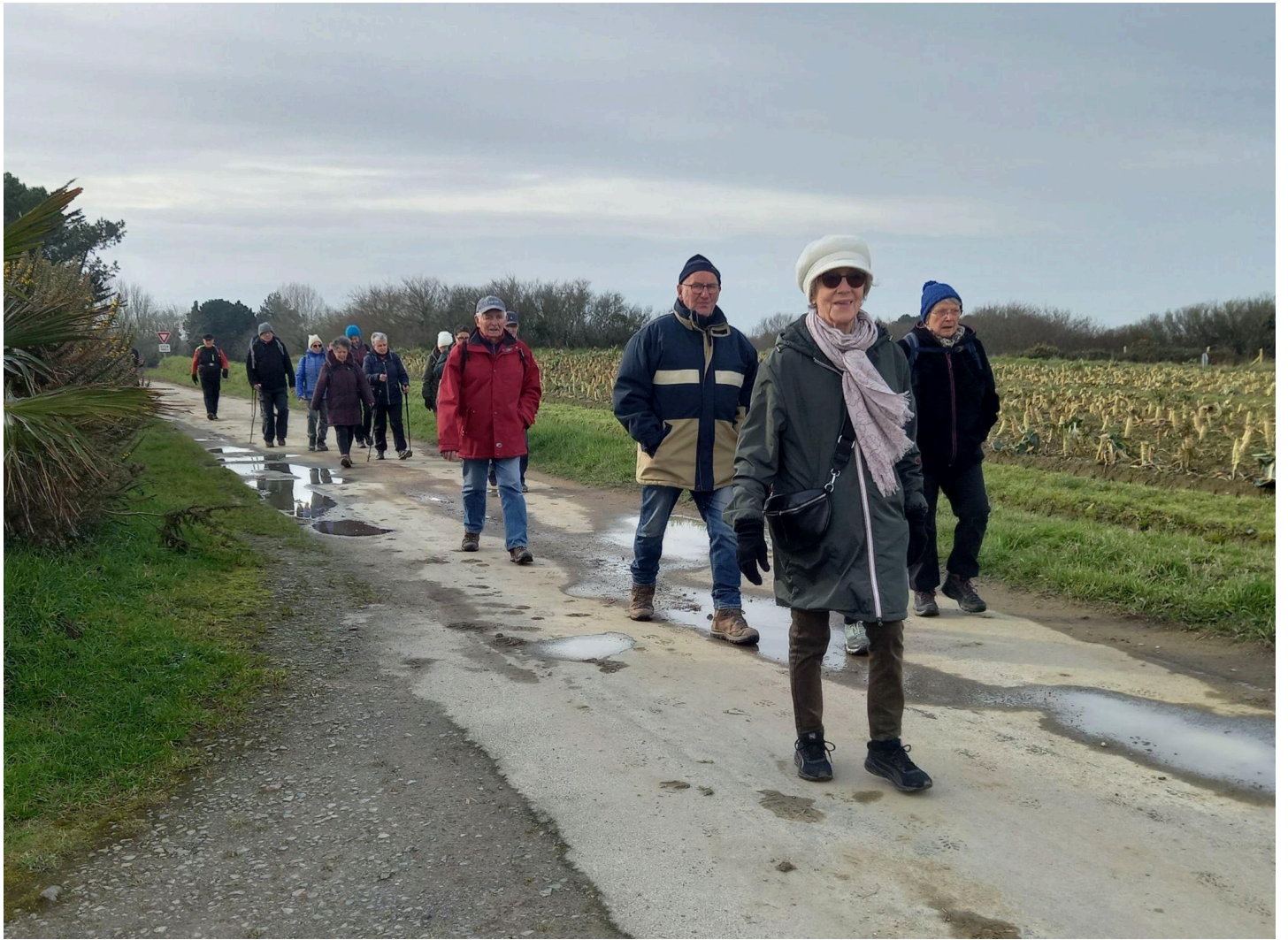
Entre les champs de choux-fleurs, sur la petite route de la Ville blanche!