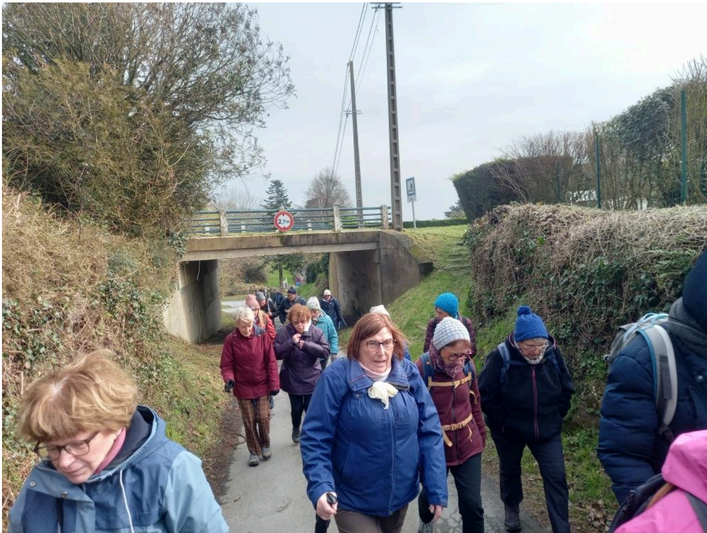
Arrivée à la basse Cancale!