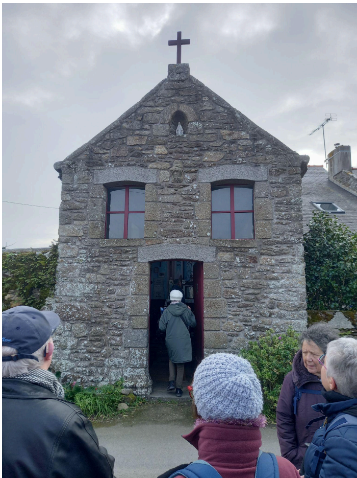
La petite chapelle du Haut-Bout!