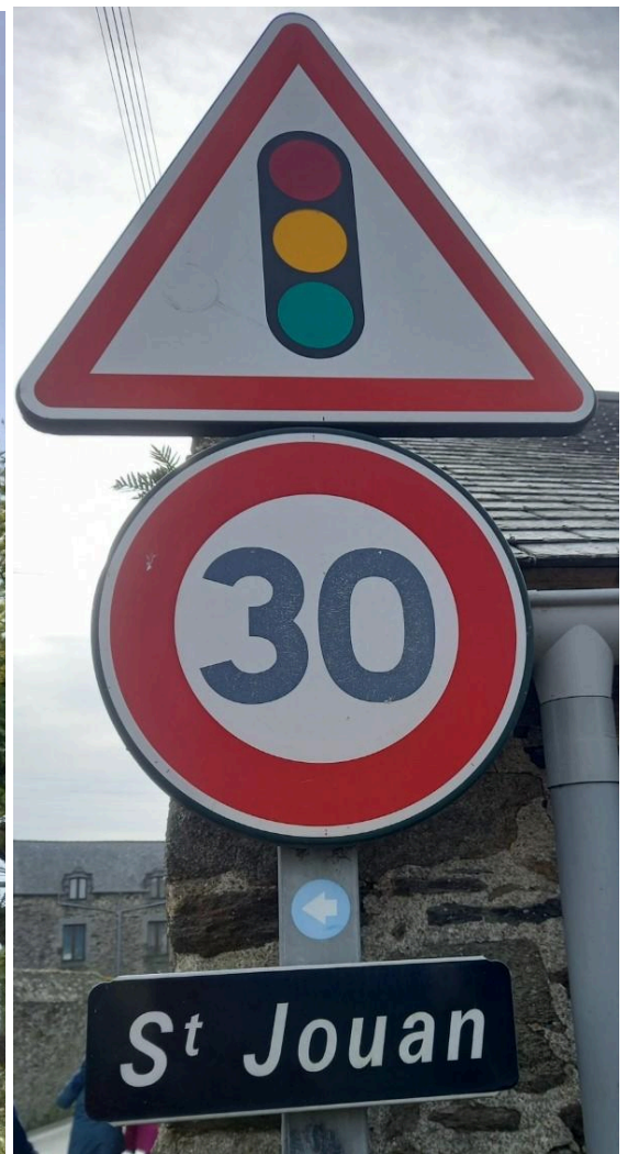
Ce St Jouan là n'est pas des Guérets!