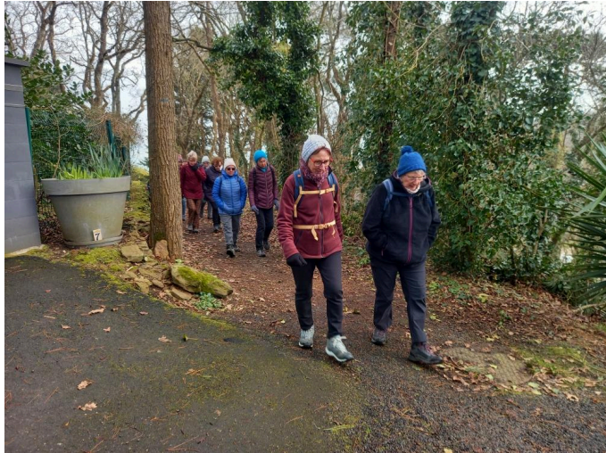
A la sortie du Chatry!