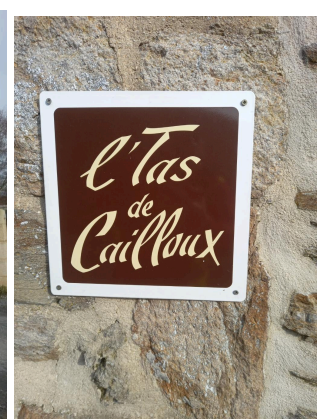
Le long de notre parcours, quelques belles maisons en pierres rénovées pour la plupart, dont l'une se nomme (ci dessus)