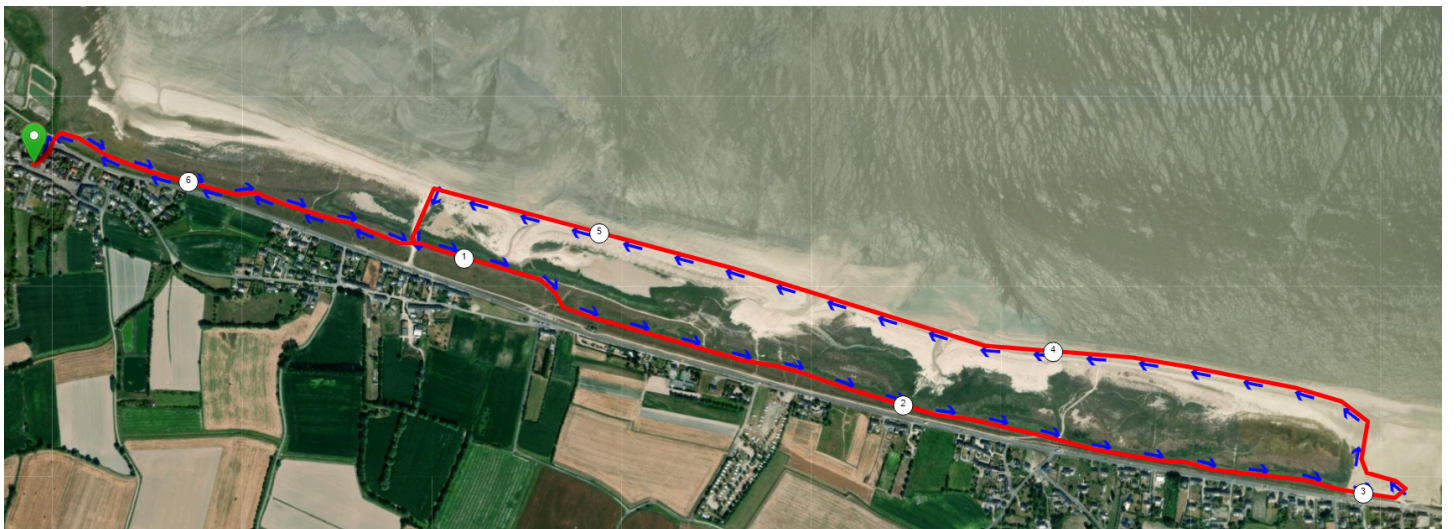
Plan du Parcours!