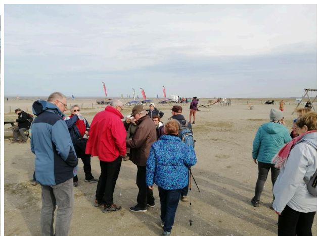
Pause sur l'aire de repos de la plage de Hirel!