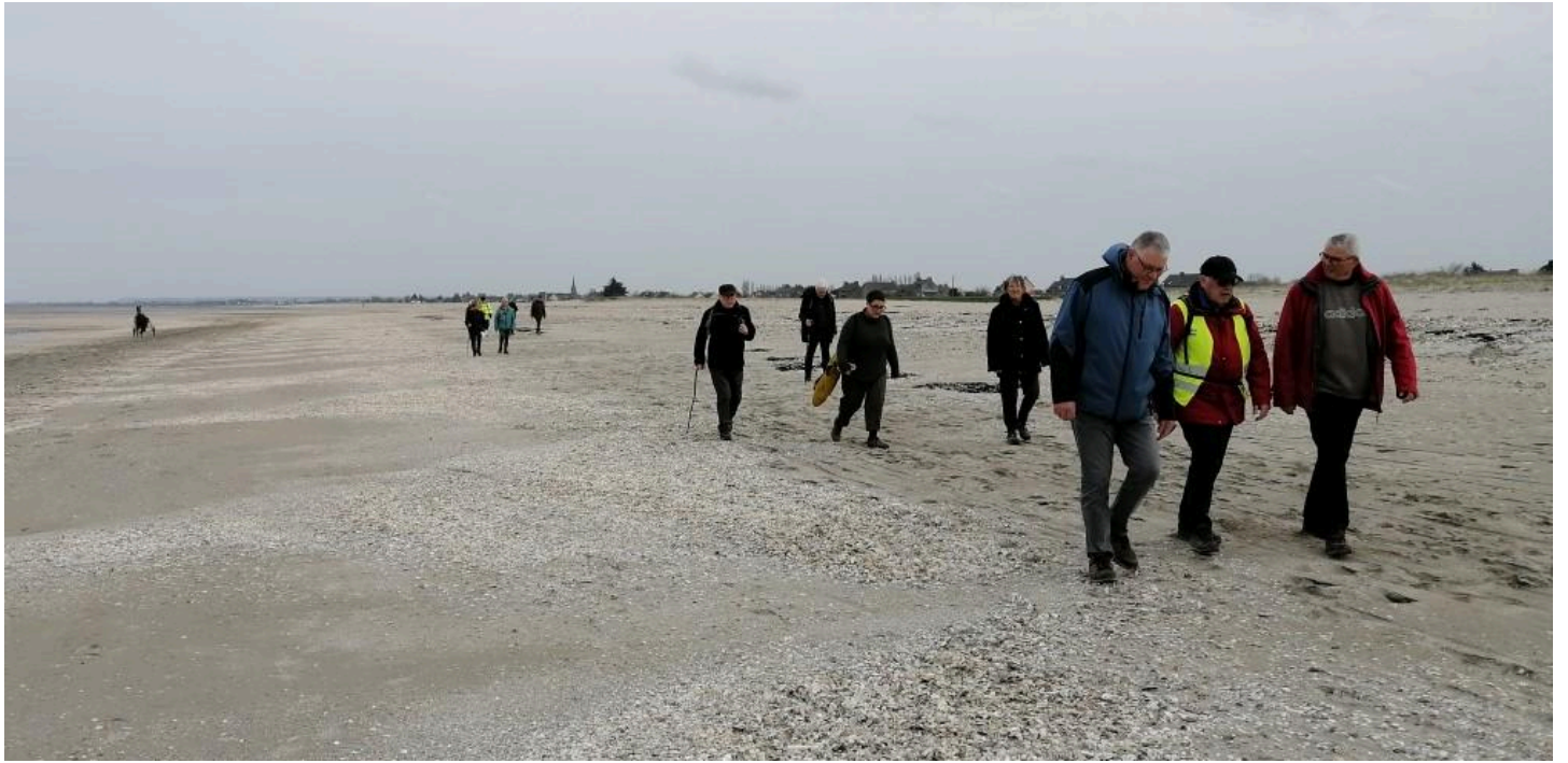
Le retour vers Vildé la Marine se fait sur l'estran, protégé du vent de sud par la dune de sable!