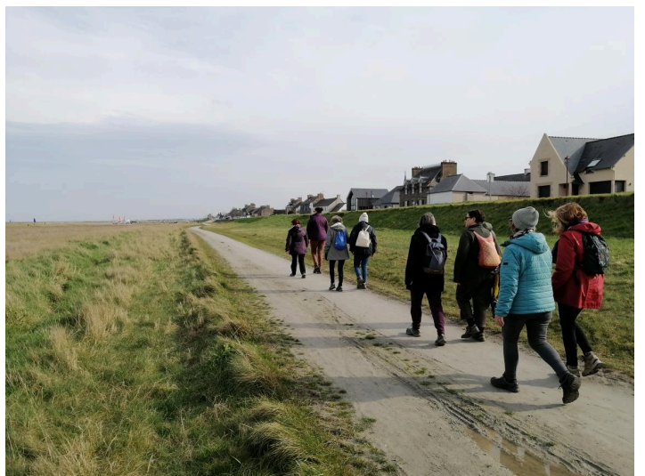
Sur la voie verte en direction de Hirel!