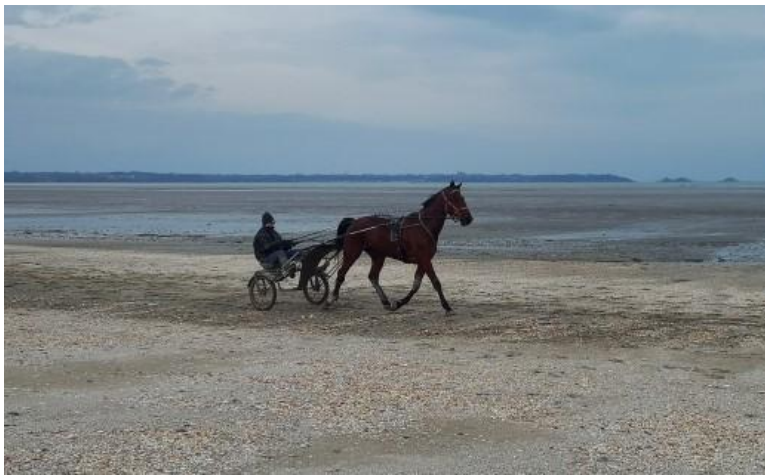
Une rencontre un peu surprenante!