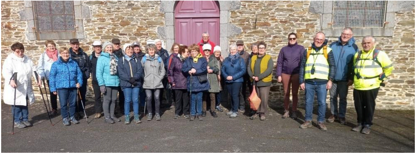
Le groupe de marcheurs du jour!