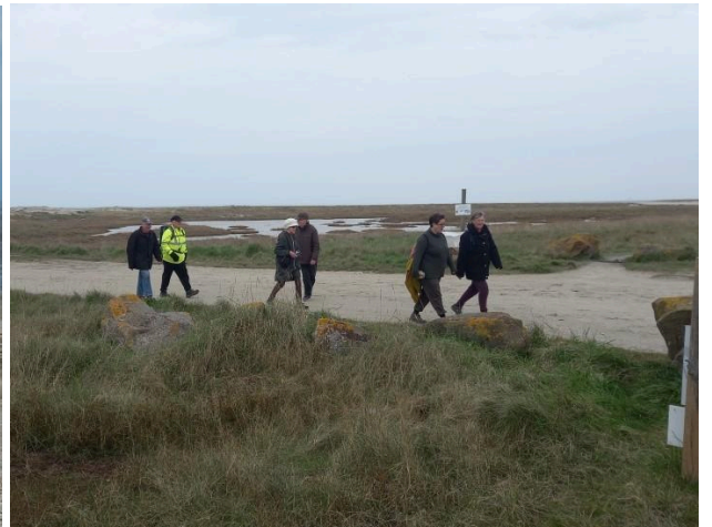
Nous retrouvons la voie verte pour la fin du parcours!