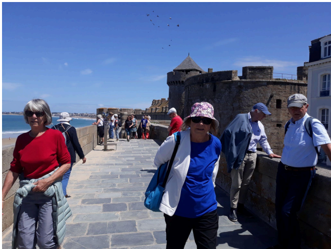
Sur les remparts près du château!

Pierre-Jacques Meslé de Grandclos, né le 4 mars 1728 à Saint-Malo et mort le 30 janvier 1806 au château de Villers-Bocage, est l'un des plus riches négociants et armateurs de son époque à Saint-Malo, qui fit fortune grâce au commerce triangulaire avec l'Afrique et les Antilles. Sur 166 voyages en trente ans, on compte 35 expéditions de Traite négrière et 30 voyages aux Antilles . Entre 1756 et 1792, sur les 17 plus gros armateurs malouins , 12 ont été négriers, selon les travaux de l'historien Alain Roman.