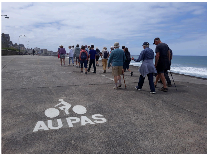
Nous étions bien les seuls à l'êtrer!