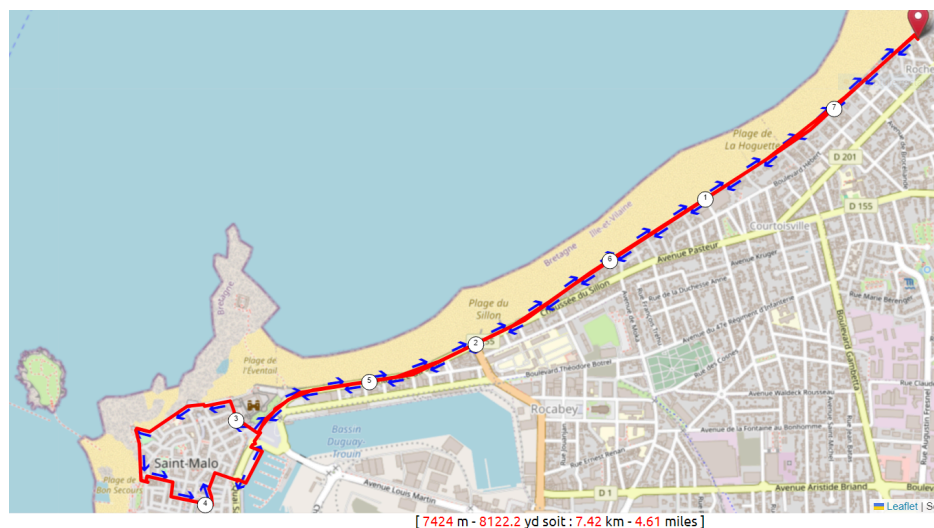
Plan du parcours!

Quai Vauban, ce bateau, modèle réduit d'un galion Espagnol, est transformé en bar, il jouit d'un certain succès!