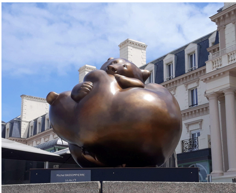
Cette année, ce sont deux oursons qui trônent aux Thermes marins!