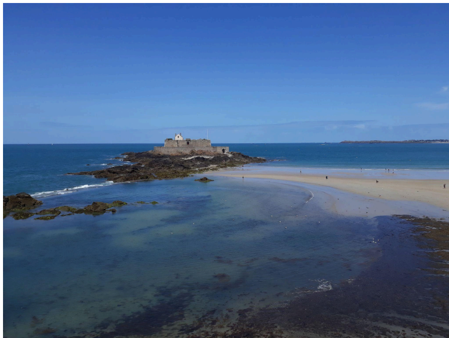
Le bleu du ciel et de la mer, duo magique!