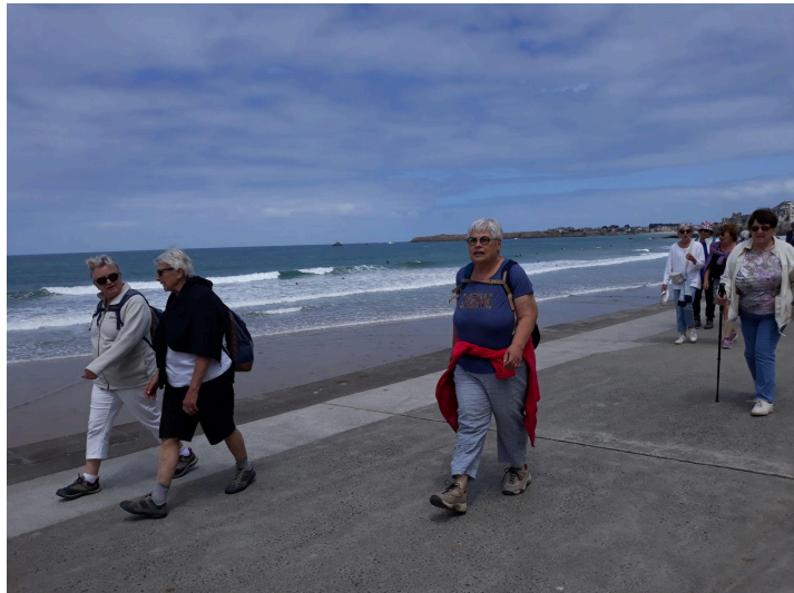
D'un bon pas sur la digue!