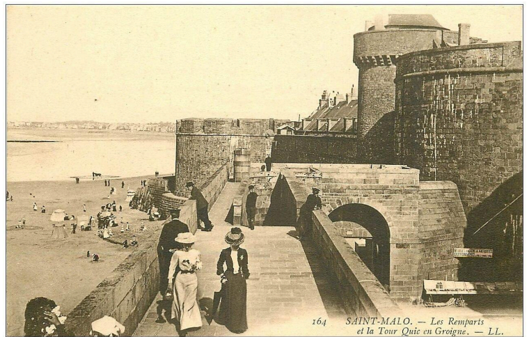
Même endroit vers 1910!