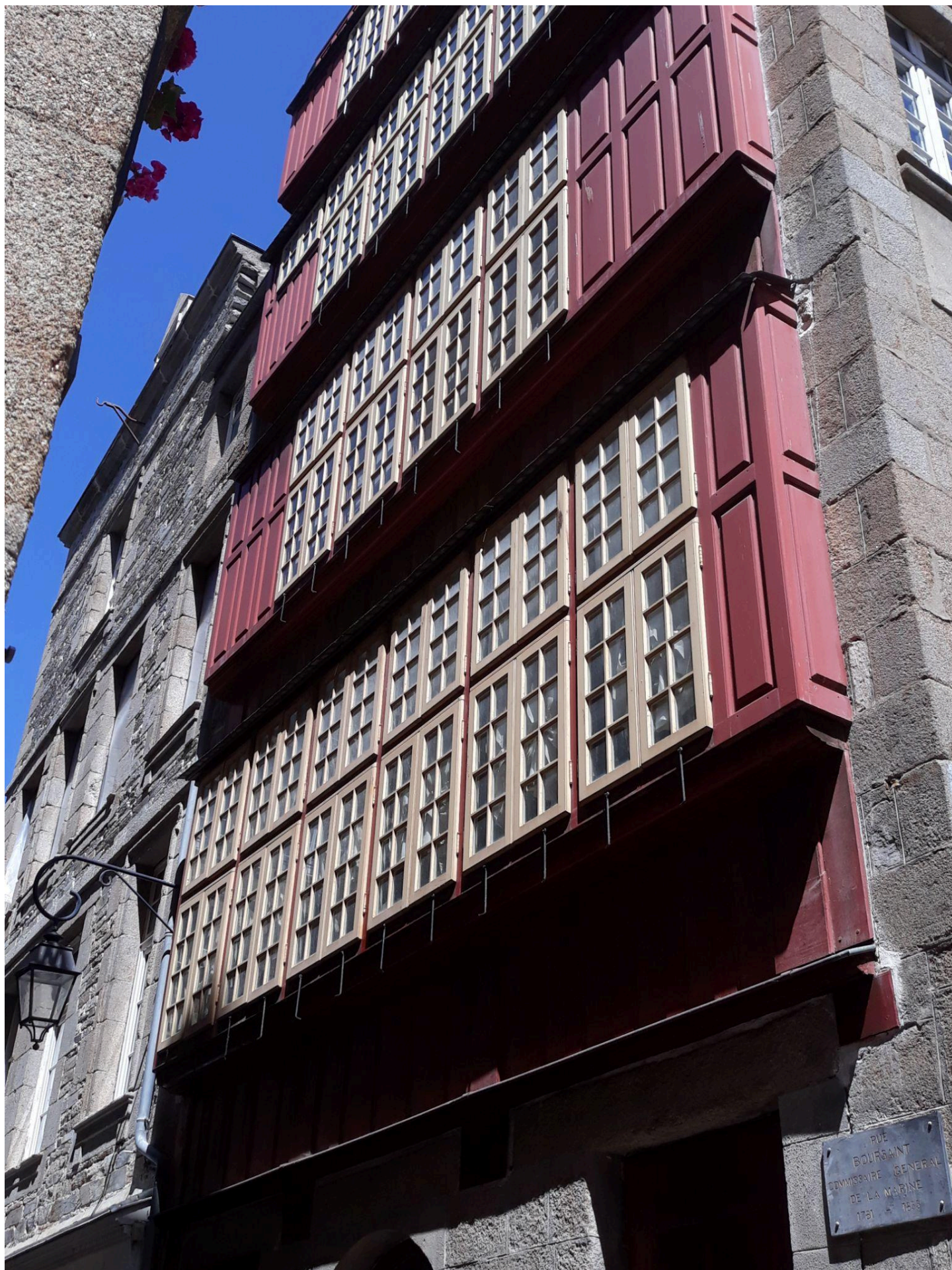
Rue Boursaint, l'immeuble rénové à l'ancienne, représente ce qu'étaient les immeubles de l'intra-muros avant la grande brûlerie du 27 octobre 1661!