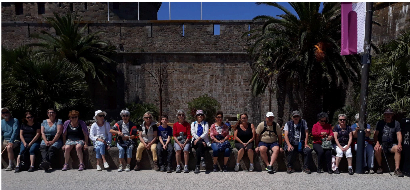
Esplanade St Vincent, pendant l'explication sur le commerce triangulaire!