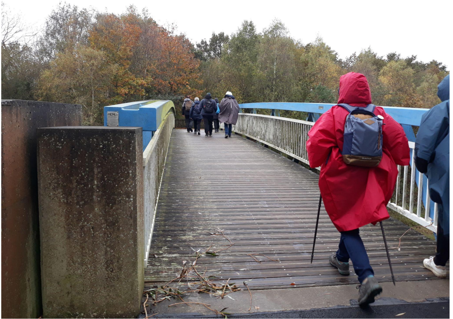
Franchissement de la passerelle sur la route Dinan/Dinard!