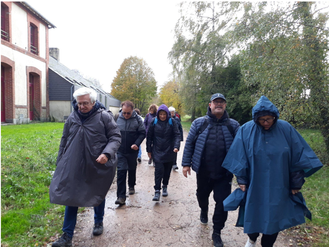
C'est parti en direction de Cap Emeraude!