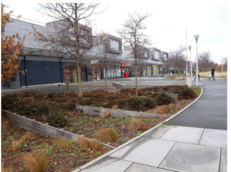
Cap Emeraude, désert!