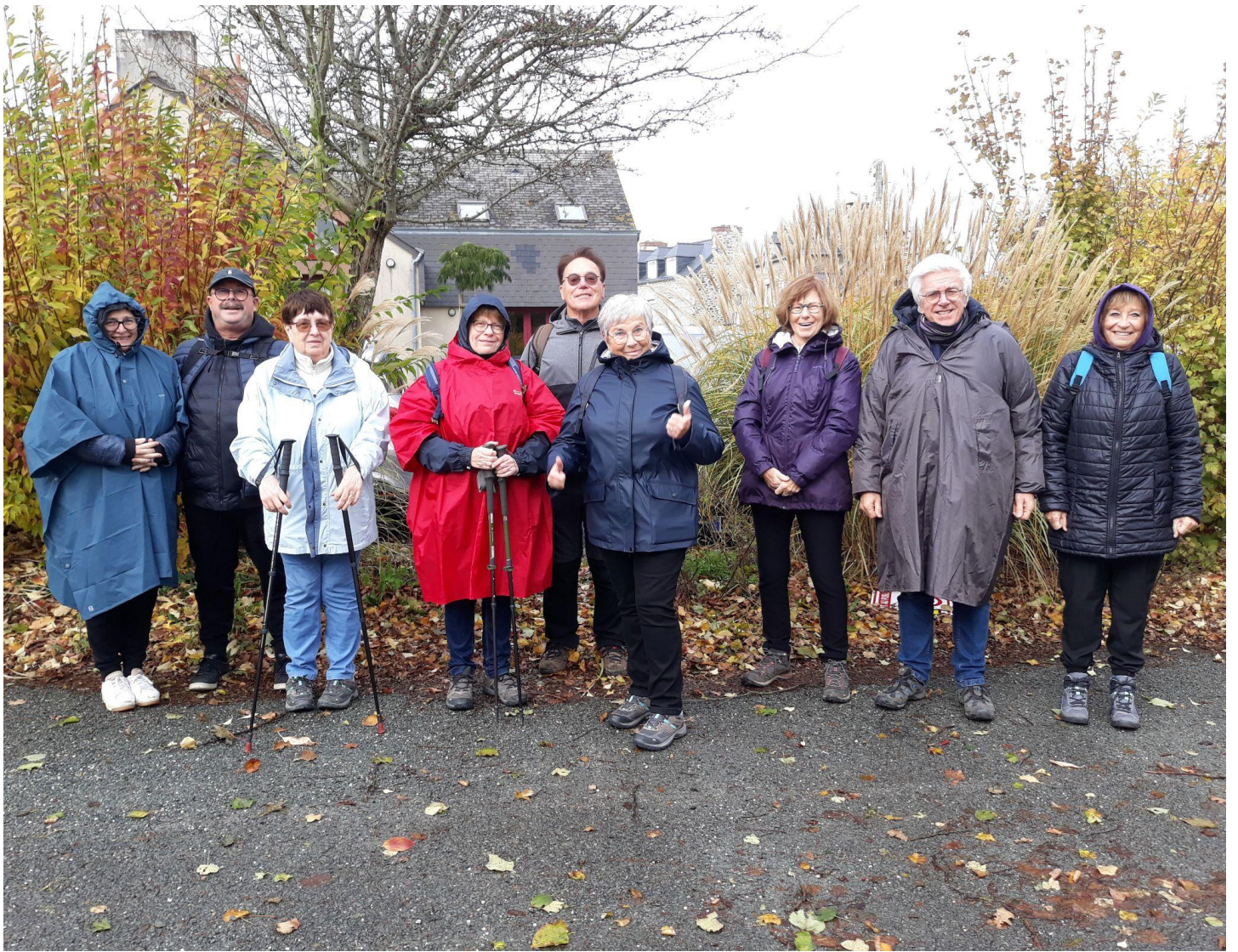
Les marcheurs téméraires du jour!