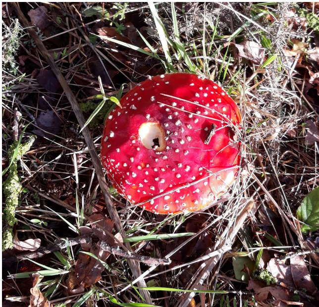
En chemin, on peut voir se genre de champignons, à éviter!